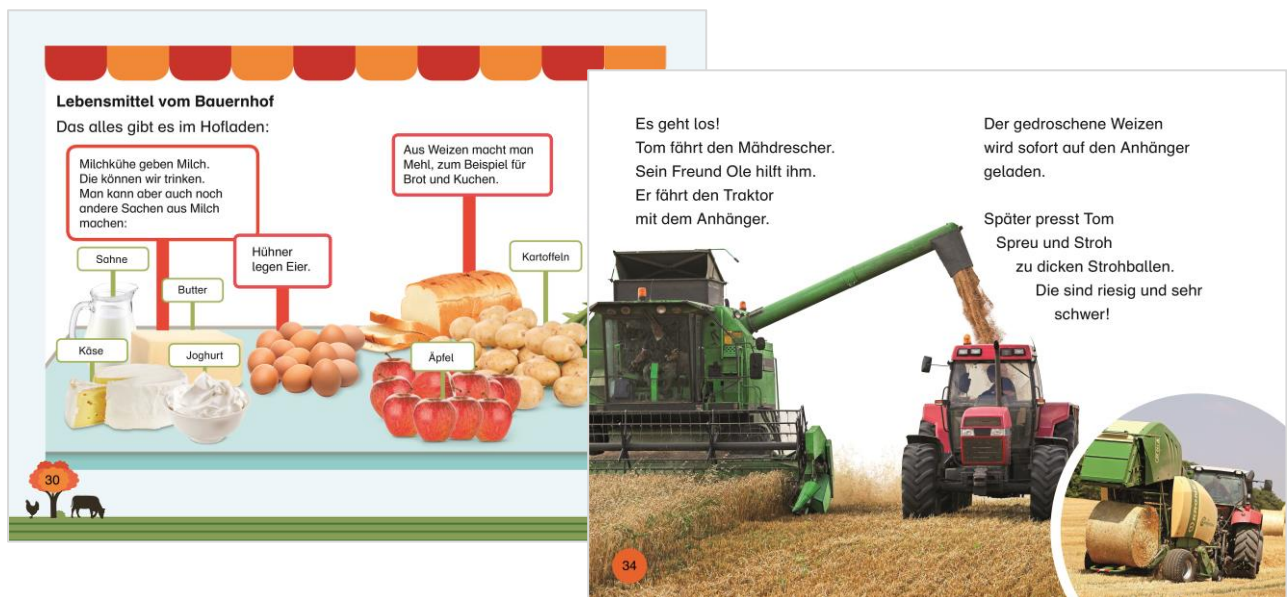
Innenansichten aus SUPERLESER! Lesestufe 1: Bei uns auf dem Bauernhof

Die Sach-Geschichten der ersten Lesestufe richten sich an Leseanfänger ab sechs Jahren und sind damit für Kids ab der ersten Schulklasse wunderbar geeignet. Wissenshungrige Kinder finden hier auf jeweils 48 Seiten spannende Geschichten zu den Themen, die sie interessieren: Sie können in die Welten ihrer Helden aus Star Wars TM , LEGO® NINJAGO® und LEGO® NEXO KNIGHTS TM eintauchen oder alles über das Leben auf dem Bauernhof erfahren. Um ihnen das Selberlesen zu erleichtern, werden die Texte der Lesestufe 1 in extragroßer Fibelschrift präsentiert. Auch zum gemeinsamen Vorlesen ist die Schrift optimal geeignet. So werden aus Leseanfängern schnell Leseprofis!