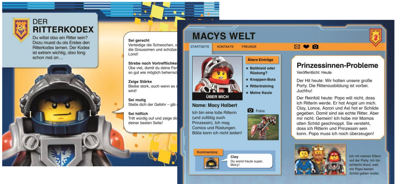
Innenansichten aus SUPERLESER! Lesestufe 2: LEGO® NEXO KNIGHTS™: Ritter gegen Monster