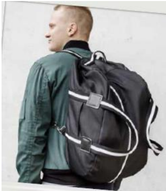
Weekender Rex #nähref