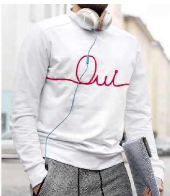
Chic Sweat Baptiste #nähbaptiste