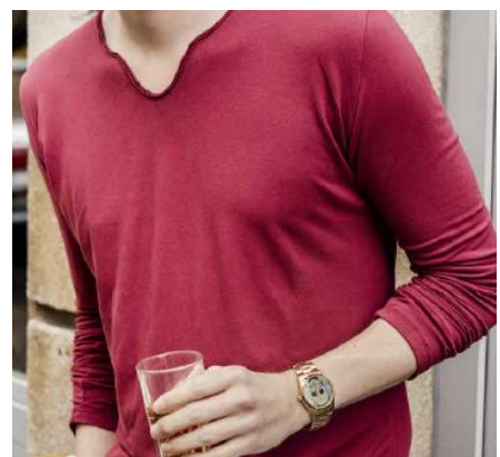
Longsleeve Malik #nähmalik