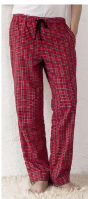
Pyjamahose Xavier #nähxavier