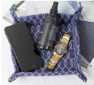
Accessoire-Case Arthur #näharthur