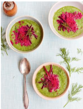
Seite 88/89 Kalte Gurkensuppe