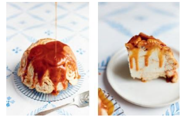
Seite 72/73 Kardamom-Eisbombe