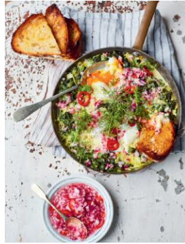
Seite 232/233 Spinatpfanne