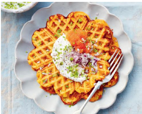
Seite 154/155 Kürbiswaffeln