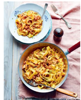
Seite 122/123 Räucherwurst Stroganoff