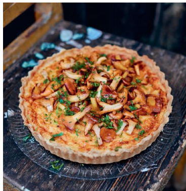
Seite 118/119 Västerbottentarte