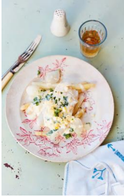
Seite 46/47 Kabeljau mit Spargel und Ei