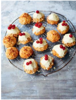
Seite 264/265 Kokosberge