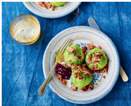
Seite 170/171 Erbsen-Kartoffel-Klöse