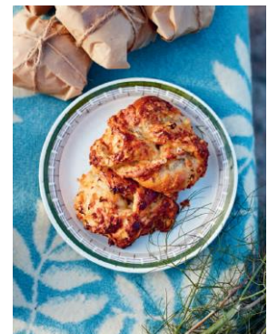
Seite 198/199/200 Dinkelwecken