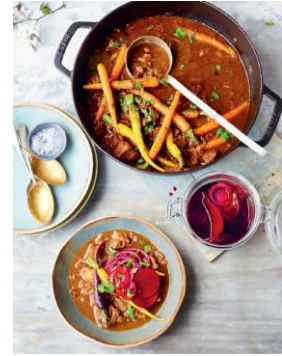
Seite 246/247 Schwedisches Gulasch