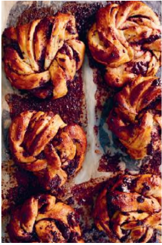
Seite 201 Himbeer-Schoko-Wecken