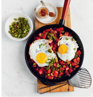
Seite 52/53 Restepfanne