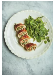
S. 186 Involtini mit Schinken und Knoblauch