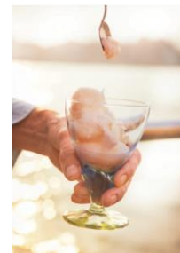
S. 138 Bellini-Sorbet