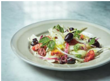
S. 94 Fenchel-Orangen-Salat mit Minze