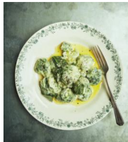
S. 116 Malfatti mit Spinat und Ricotta