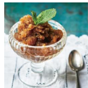
S. 293 Espresso-Sambuca-Granita