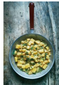
S. 200 Venezianische Kartoffeln