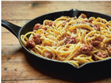
S. 54 Bucatini mit Wurst und Ei