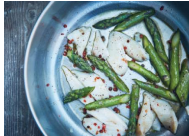
S. 66 Petersfisch mit Spargel und Basilikum