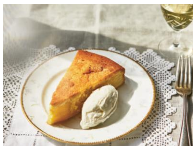
s. 208 Olivenölkuchen