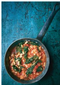
S. 158 Ribollita