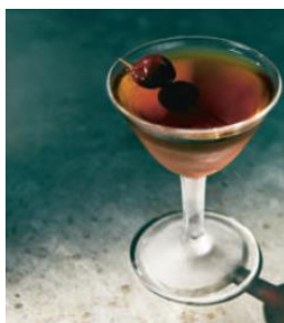
S.292 Venezianischer Manhattan