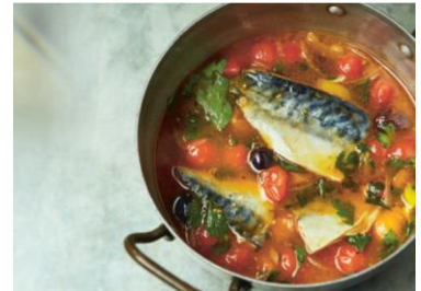
S. 68 Makrelen-Caponata