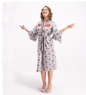
S. 92-95: Wellnesskimono