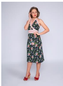
S. 58-61: Strandkleid