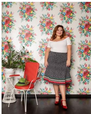
S. 74-77: Fast schon eine Dirndlbluse