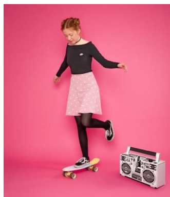
S. 128-130: Skategirl-Rock