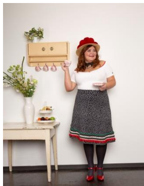
S. 82-85: Sweatrock mit Saumborte