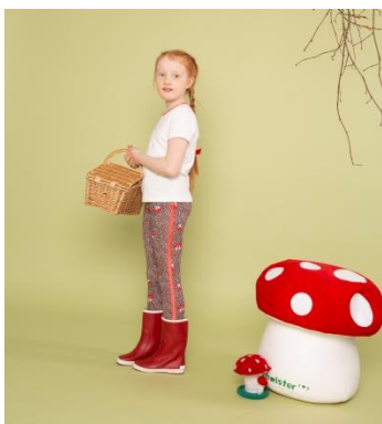
S. 122-125: Kinderleggings