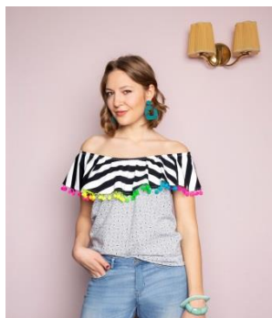
S. 62-65: Volanttop