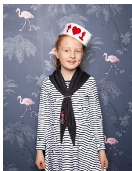
S. 54-55: Dreieckstuch mit Schlaufe