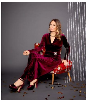
S. 102-105: Glamouroverall