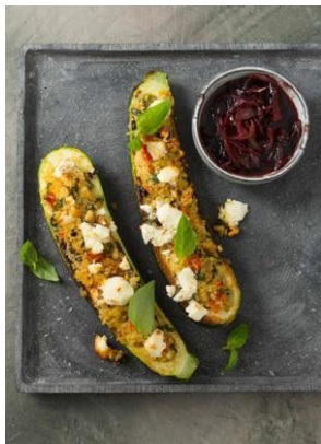
S. 98-99: Gefüllte Zucchini, Bulgur, Feta, Vadouvan-Zwiebel-Confit