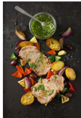
S. 114-115: Kalbspailard, Grenaille-Kartoffeln, Ofengemüse, Oliven, Pesto