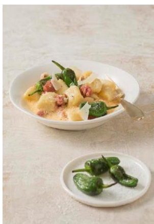
S. 122-123: Parmesan-Ricotta- Gnocchi, Salsiccia, Paprikaschaum