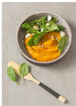
S. 10-11: Karottenhummus, Spinatsalat, Feta, Sesam