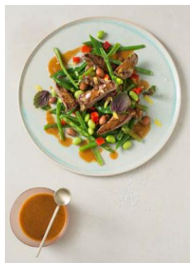
S. 60-61: Bunter Bohnensalat, Zitronen-Tahin-Dressing, Rinderstreifen