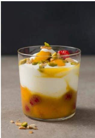
S. 190-191: Türkischer Joghurt, Aprikosen, Nüsse und Himbeeren