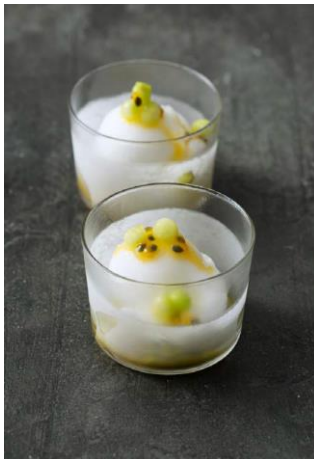
S. 200-201: Gin-Tonic-Sorbet, Gurke, Passionsfrucht