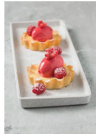
S. 210-211: Sauerrahm-Limetten-Tarte, Himbeersorbet