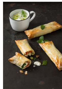
S. 18-19: Mediterraner Gemüse- Börek, Tsatsiki