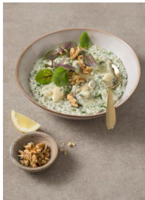
S. 108-109: Kräuterrisotto, Roquefort, Walnüsse