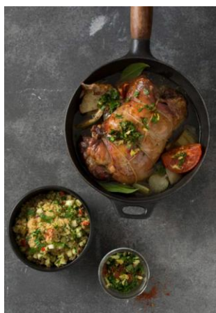
S. 140-141: Lammschulter geschmort, Kardamom- Gremolata, Gemüsebulgur