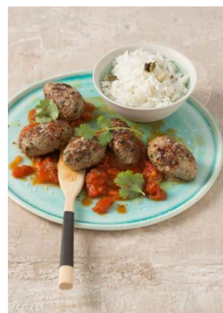
S. 126-127: Kebab, Tomatengewürzsauce, Kardamomreis