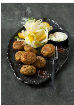
S. 20-21: Falafel, Limettenjoghurt, Aprikosen-Fenchel-Salat