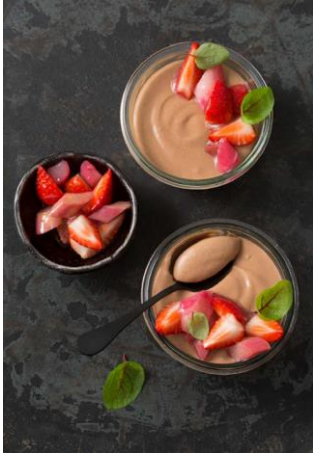
S. 178-177: Dunkle Mousse au Chocolat, Rhabarber, Erdbeeren