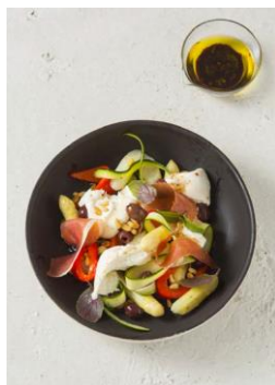
S. 12-13: Gemüse-Spargel-Salat, Burrata, Serrano, Taggiasca-Oliven