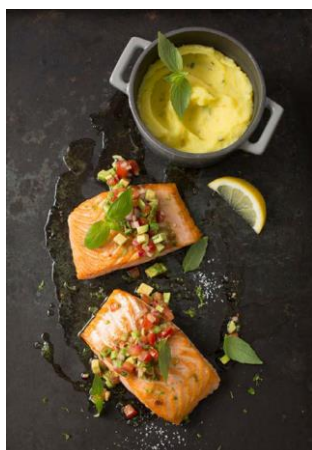
S. 156-157: Bio-Lachs, Tomaten-Avocado-Salsa, Zitronen-Thymian-Püree