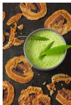
S. 44-45: Bärlauchcremesuppe, Pancetta