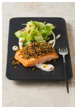
S. 84-85: Wildlachs in Sesam-Pfeffer-Kruste, Gurke, Ingwer, Kardamomjoghurt