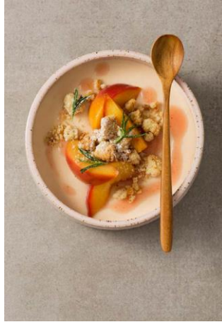
S. 182-183: Mousse und Geschmortes vom Pfirsich, Rosmarinstreusel