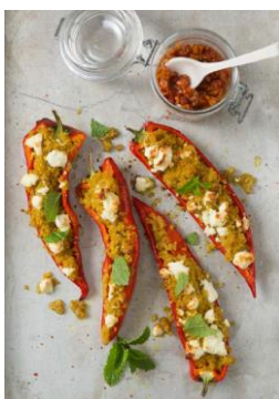
S. 22-23: Gefüllte Spitzpaprika, Bulgur, Feta, Tomatenconfit