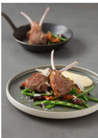
S. 124-125: Lammkoteletts vom Grill, Parmesanpolenta, Oliven-Korinthen-Bohnen