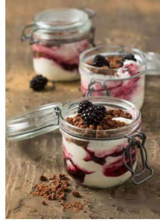
S. 186-187: Brombeer-Topfen-Mousse, Schokoladenstreusel