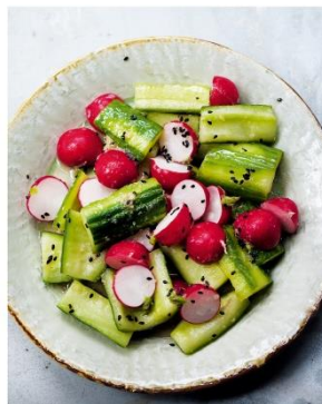
S. 98/99 Gurken-Radieschen- Salat