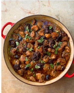
S. 184/185 Schweinefleisch mit Dörripflaumen