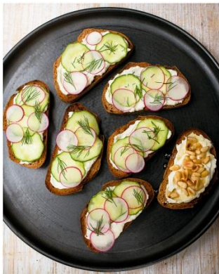
S. 30/31 Toasts mit Fetacreme

© Text: Nigella Lawson, f. d. dt. Ausgabe Dorling Kindersley Verlag