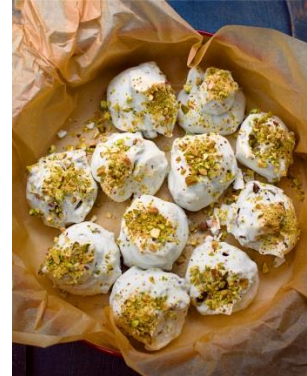
S. 266/267 Baisers mit Schokotropfen