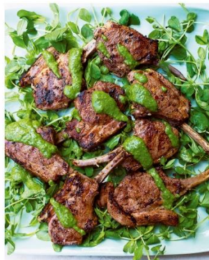
S. 172/173 Lammkoteletts mit Chili