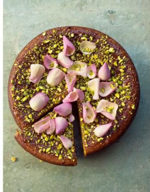
S. 234/235 Birnenkuchen