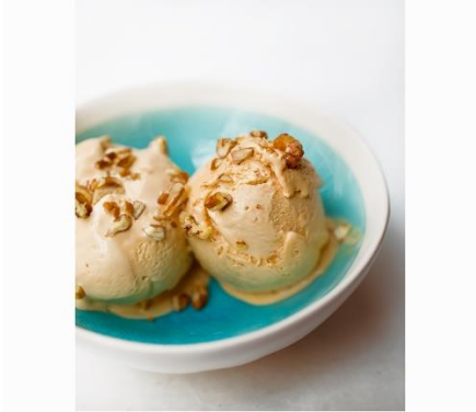
S. 230/231 Salz-Karamell- Eiscreme