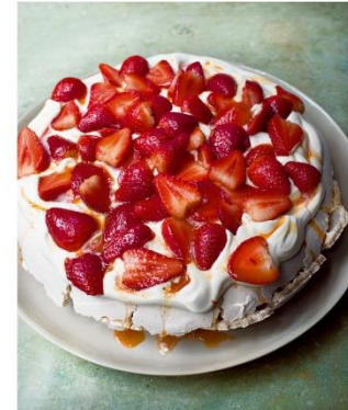
S. 208/209 Pawlowa aus Rosen- Pfeffer-Baiser