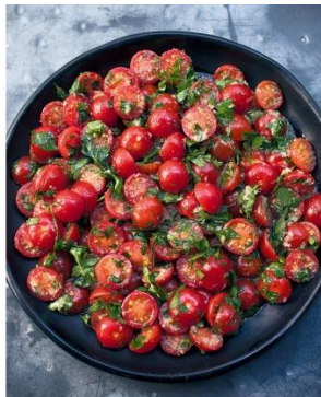
S. 88/89 Tomatensalat mit Meerrettich