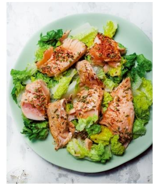
S. 128/129 Lachsfilet aus dem Ofen