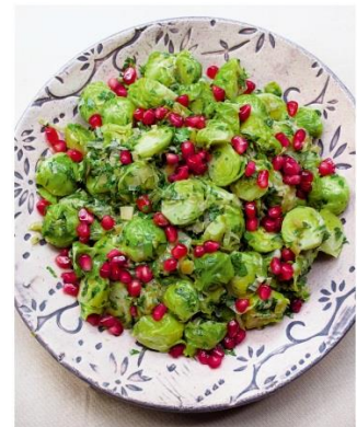
S. 76/77 Rosenkohl mit Salzzitronen und Granatapfel