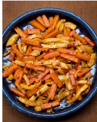
S. 60/61 Möhren und Fenchel mit Harrissa